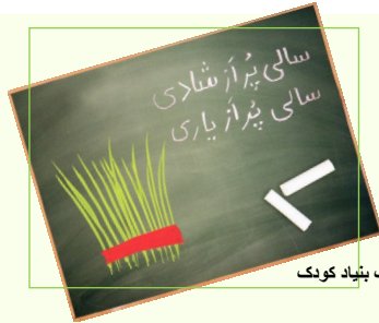
کارت تیریک بنیاد کودک

امروزه بین انواع الگوهای توسعه، الگوی توسعه یا نوسازی انسانی بر سایر الگوها ارجحیت یافته است. جوامع در حال توسعه از جلوه های نوین توسعه یافتگی هم در محتوی و هم در مصادیق عینی بر خوردارند که برای پیشبرد اهداف توسعه در جامعه ایران نیز می‌توانند به کار گرفته شوند. الگوی توسعه انسانی مبتنی بر تغییر و کنار گذاشتن باور قدیمی بنا شده که معتقد بود باید انسان را از نتایج توسعه بهره‌مند ساخت! و از توسعه برداشتی صرفاً اقتصادی داشت. نظریه پردازان اجتماعی به این باور رسیده‌اند که برداشت صرفاً اقتصادی از توسعه نمی‌تواند راهگشا باشد. راه رسیدن به توسعه از طریق ساختن آسمان خراش‌ها و راه‌ها و پل‌ها و اتوبان‌های چند طبقه و بیمارستان‌های عریض و طویل و مراکز آموزشی مجلل نیست بلکه هدف از توسعه ایجاد امکانات برای دستیابی انسان‌ها به دانایی و توانایی با کمترین هزینه و بدون تخریب طبیعت و پرهیز از ریخت و پاش‌های غیر ضروری و لوکس است. لذا در جوامع توسعه یافته آموزش و توانمند سازی به دست مردم و مشارکت داوطلبانه آنان سپرده شده نه دولت!